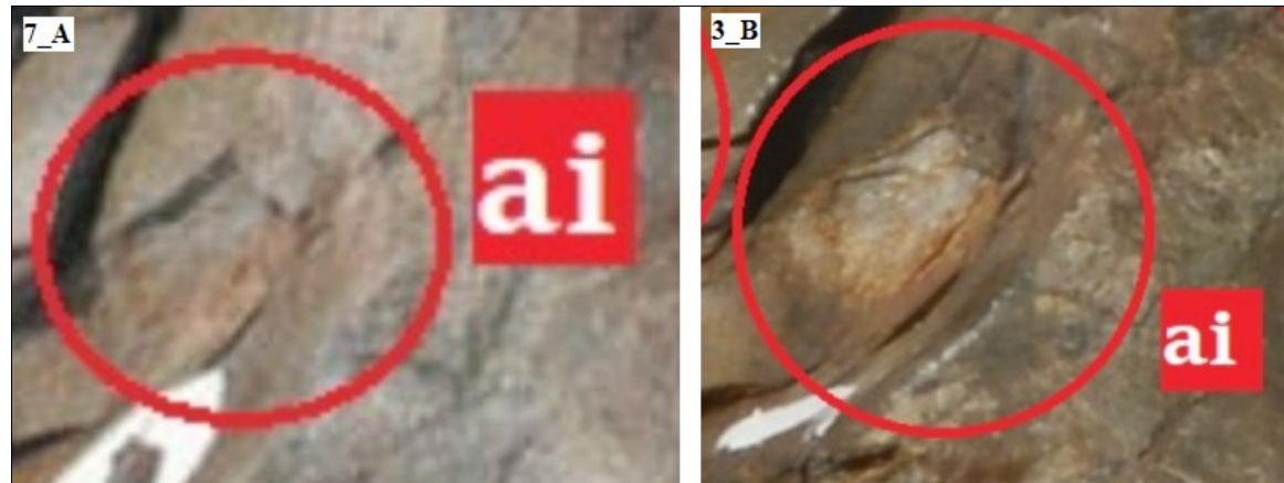
Visione di dettaglio